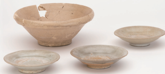
S3地区 墓出土 白磁碗・皿

申込期間 令和6年1月2日(火) 松岡千寿 ~令和6年2月14日(水) (当館学芸員)