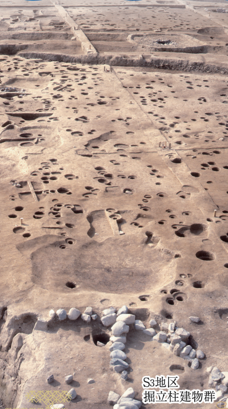
S3地区 掘立柱建物群

たつの市に所在する福田片岡遺跡は、太子竜野バイパス建設にともなう発掘調査の結果、中世の建物跡や道路が見つかりました。遺跡の位置する一帯は、古代から中世にかけて存在した法隆寺領播磨国鶴荘にあたります。鶴荘については、 しかるかのしよ 荘園絵図が伝来しており、福田片岡遺跡の場所には、元寇に備えて整備された九州と京都を結ぶ筑紫大道(中世山陽道)が記されています。このことから、見つかった道路は、この筑紫大道と考えられ、絵図の記載が考古学からも実証されました。さらに、遺跡は揖保川の支流、林田川と筑紫大道が交わる「結節点」に位置する物流拠点である為、中国産をはじめ、他地域の様々な陶磁器類が出土しています。本展では、中世の人や物の交流の一端を、福田片岡遺跡の調査結果から紹介します。