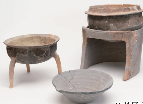
N1地区 溝出土 土器