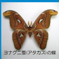
ヨナグ二蚕(アタカス)の蝶

絹糸の素、いろいろな繭を見ながら、繭の違いによる絹糸の違いを作り方も含め解説。併せて、繭から真綿、真綿から真綿糸系作りの実践・体験を実施。